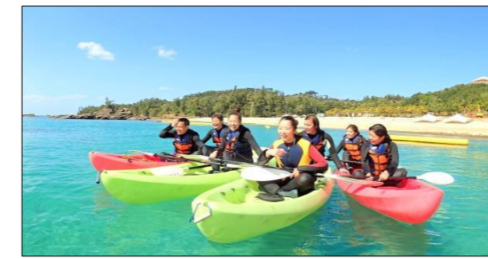
オーシャンカヤック