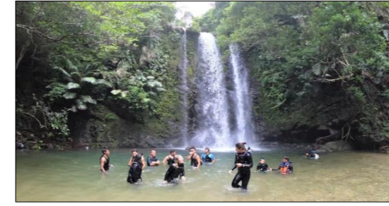
リパートレッキング