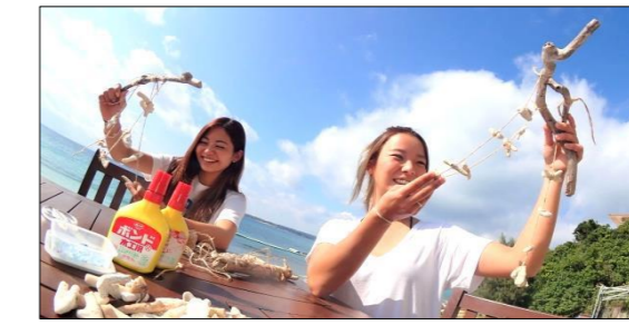
マリクラフト サンゴ風鈴教室