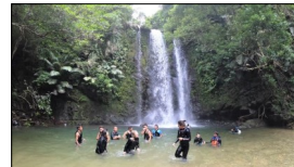
リポートレッキング