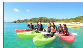
オーシャンカヤック