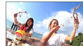
マリクラフト サング風鈴教室